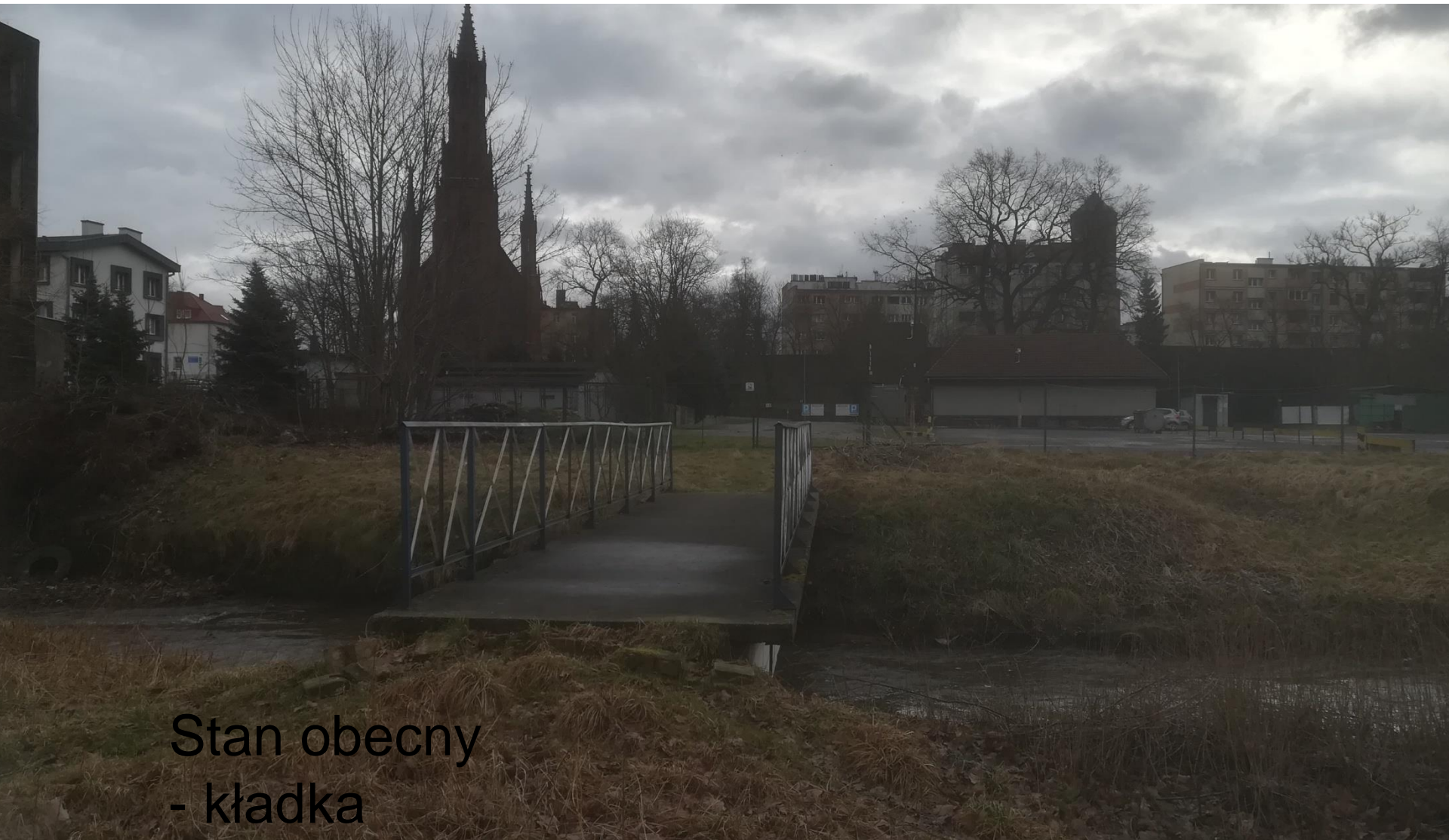
Stan obecny - kładka