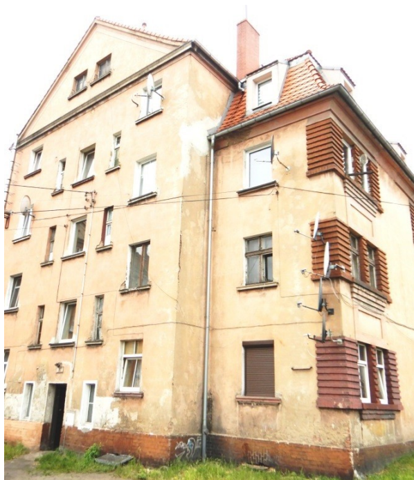
Ogólny widok budynku

na sprzedaż lokalu mieszkalnego Nr 6 znajdującego się w budynku położonym w Lubaniu przy ul. Juliusza Słowackiego 15C wraz z udziałem we współwłasności nieruchomości gruntowej (działka nr 58/9, AM 14, Obręb I o powierzchni 248 m 2 , JG1L/00023916/1)